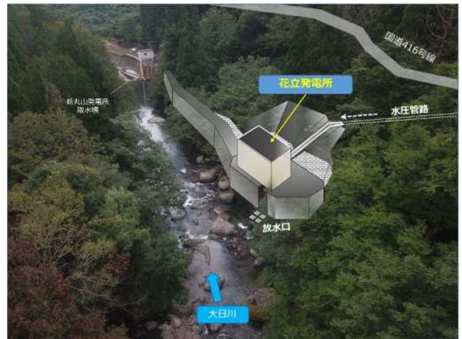
発電所建設予定地（河川上流から見たイメージ）