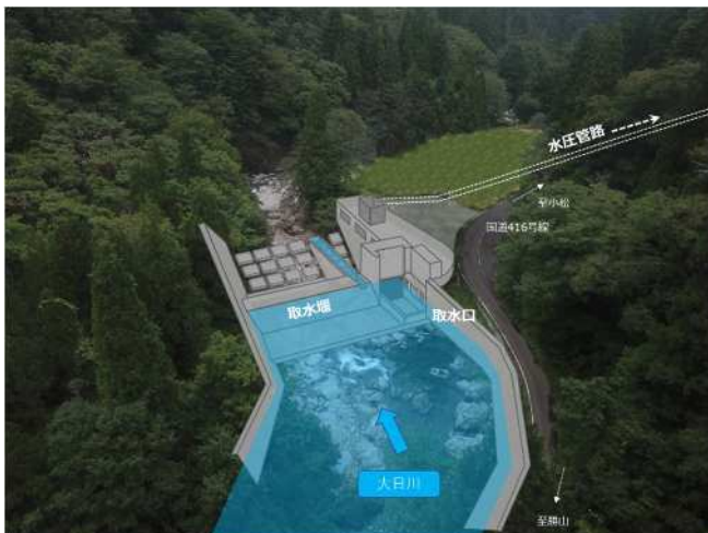
取水設備建設予定地（河川上流から見たイメージ）